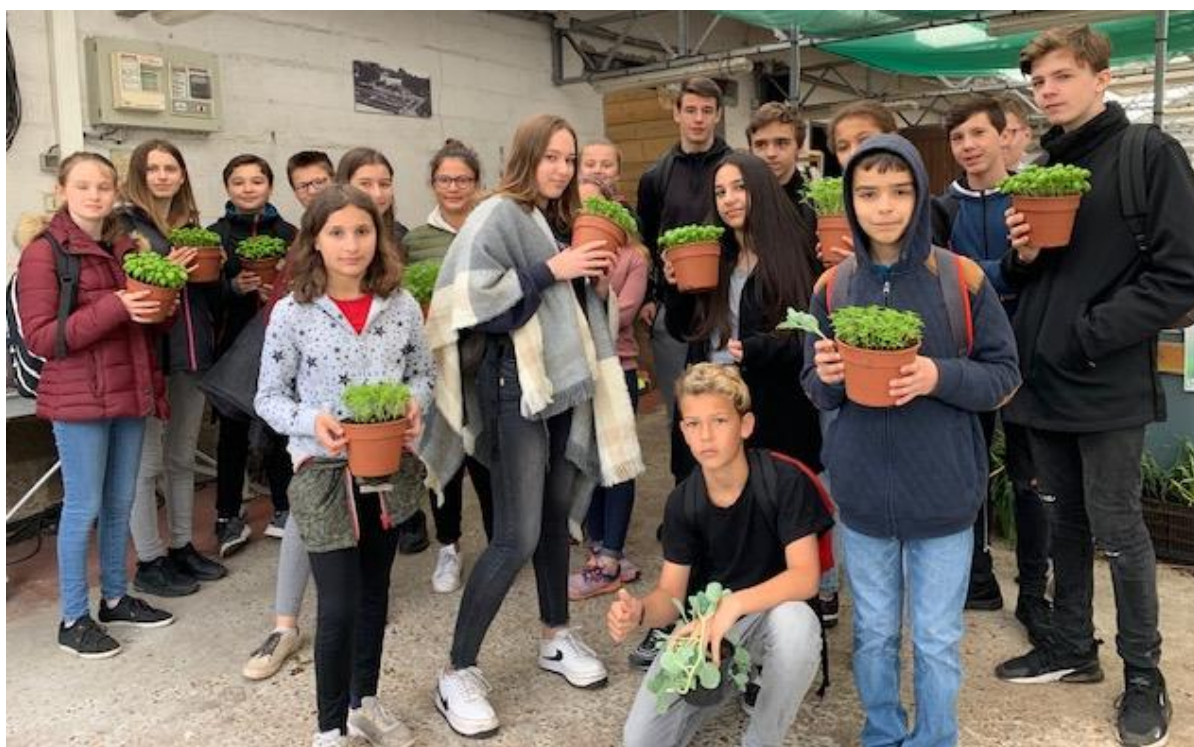
Après avoir goûté à la menthe chocolat, la menthe hollywood, chacun repart avec son pot de basilic: succès garanti.