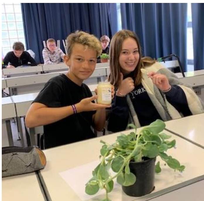
Dégustation du miel au collège