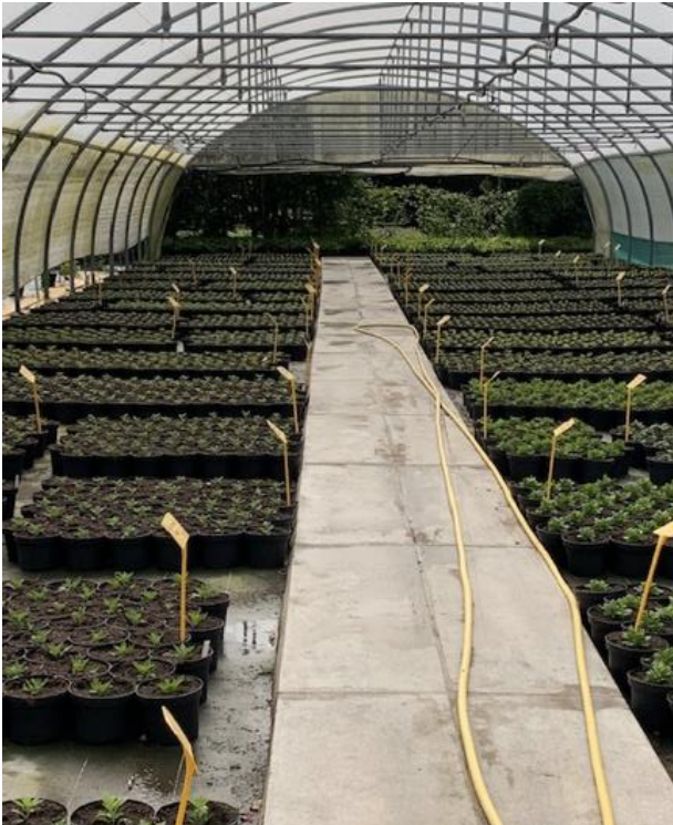
Les chrysanthèmes sont déjà en culture au chaud pour la Toussaint